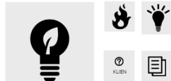
Breakout 1: Neue Ideen für brennende Probleme